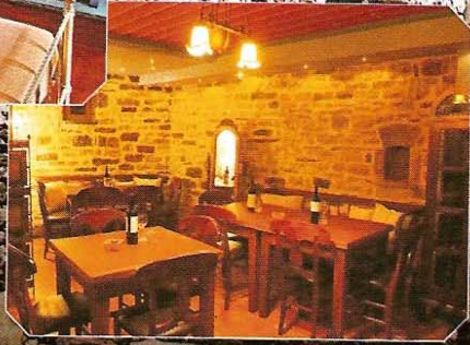
"Αρχοντικό Δίλοφο" τα περισσότερα δωμάτια διαθέτουν δικά τους τζακι.